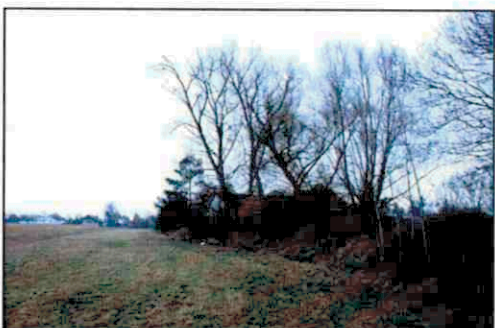
Böschung als nördliche Abgrenzung des Geltungsbereiches, Bestandsgehölze der Nachbaranwesen