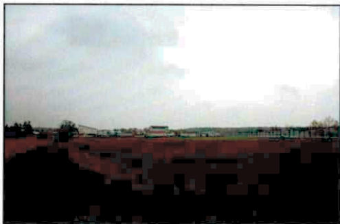
Ackerfläche, östlich liegende Gewerbebetriebe, Baumreihe entlang KEH 7