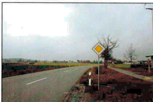
KEH 7, Baumreihe, Gehweg