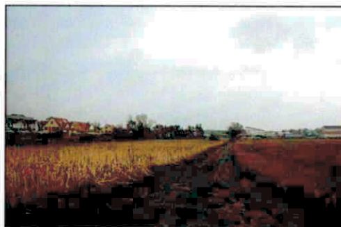
Ackerfläche, Zuwegung zum Stillgewässer, Auengebüsch