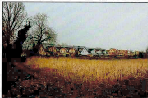
Nördlich angrenzendes Wohngebiet