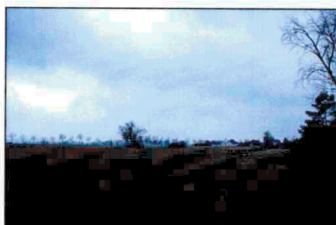
Grünland, Auengebüsch, Baumreihe